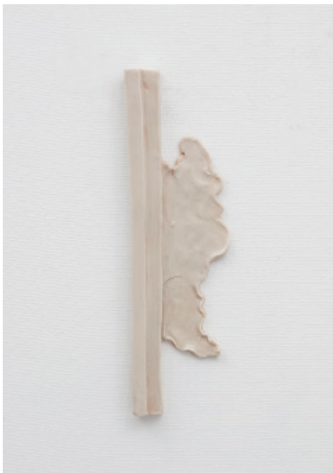
12. 背後の手前 2017 セラミック 23.0x65.0x1.2cm