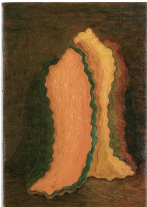
20. 背後の手前 2017 油彩、キャンバス SM 22.8x15.9x2.3cm