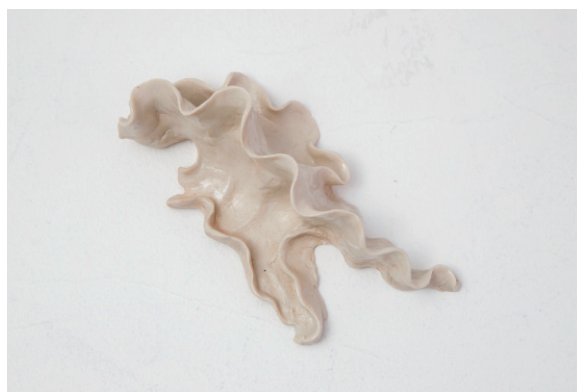
16. 夢 2017 セラミック 5.0x7.0x15.5cm