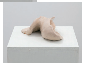
13. 夢 2017 セラミック 6.5x16.5x11.5cm