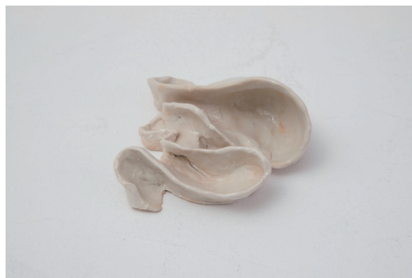
15. 夢 2017 セラミック 5.0x10.0x10.5cm