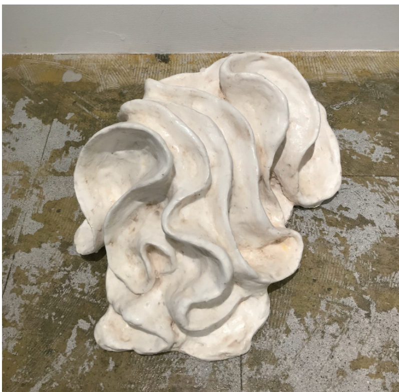
3. 夢 2017 樹脂、石膏、蜜蠟 210x430x270mm