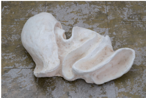
2. 夢 2017 樹脂、石膏、蜜蠟 140x500x360mm