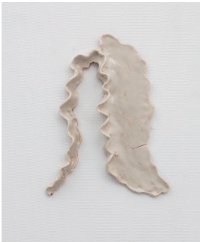
14. 背後の手前 2017 セラミック 18.0x13.5x2.3cm