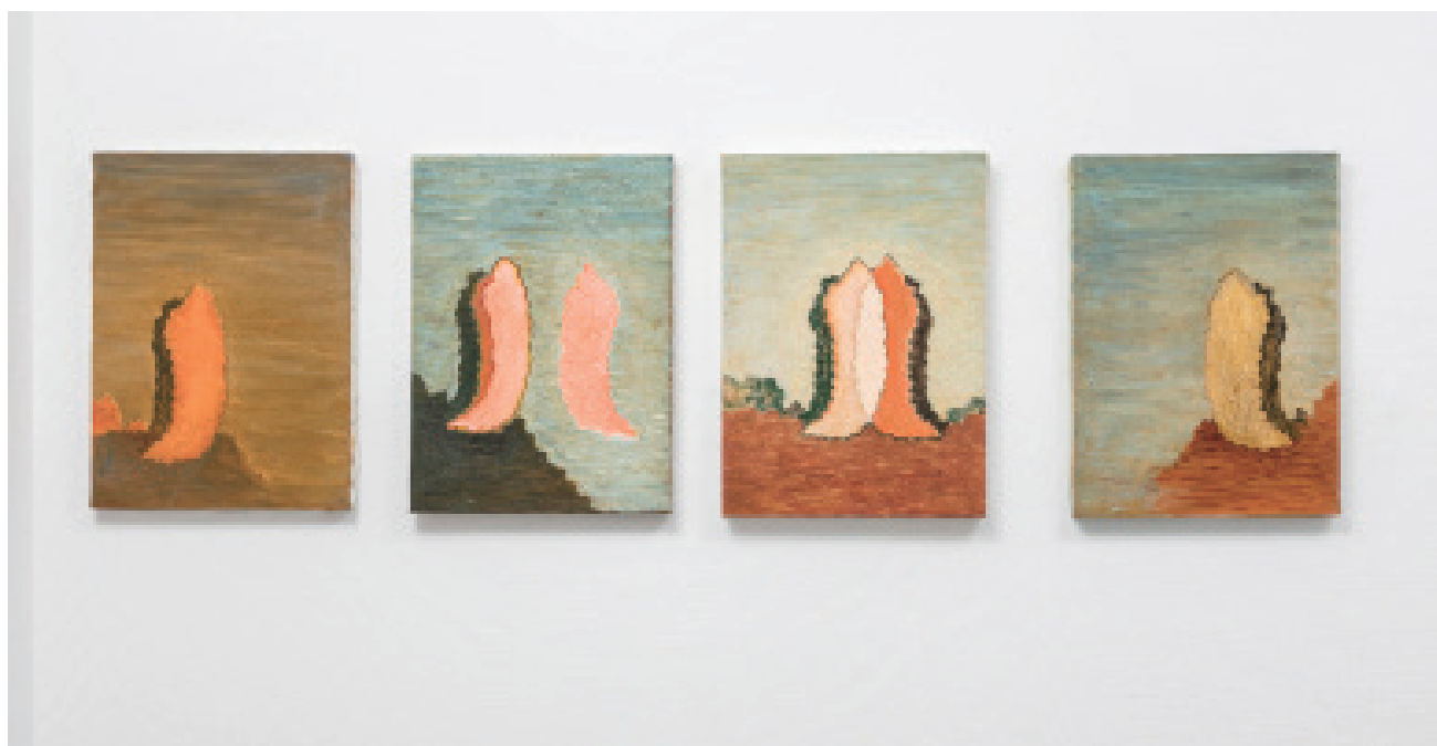
18. 背後の手前 2017 油彩、キャンバス 33.5x24.4x2.3cm × 4枚