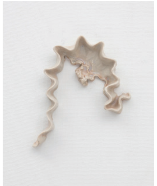
11. 背後の手前 2017 セラミック 18.0x16.0x3.0cm