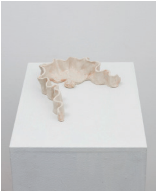
10. 背後の手前 2017 セラミック 5.0x21.0x16.5cm