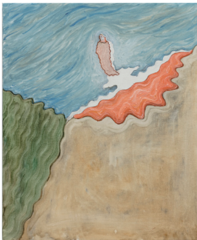
17. 無題 2017 油彩、キャンバス 60.8x50.1x12.5cm